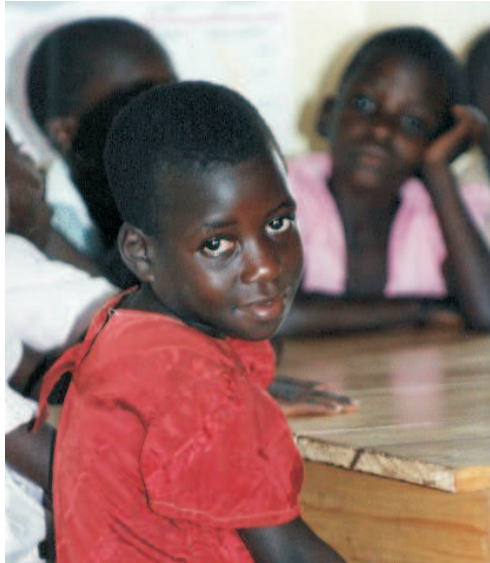
in de kleuterschool

KCC werkt in de directe omgeving van het plaatsje Kibaale . Er is veel ar-moede in dit landbouwgebied, maar gelukkig is er meestal voldoende te eten. Drinkwater is wel een probleem, er is bijna geen schoon water te vinden. Op het project wordt regenwater opgevangen en in grote tanks bewaard.