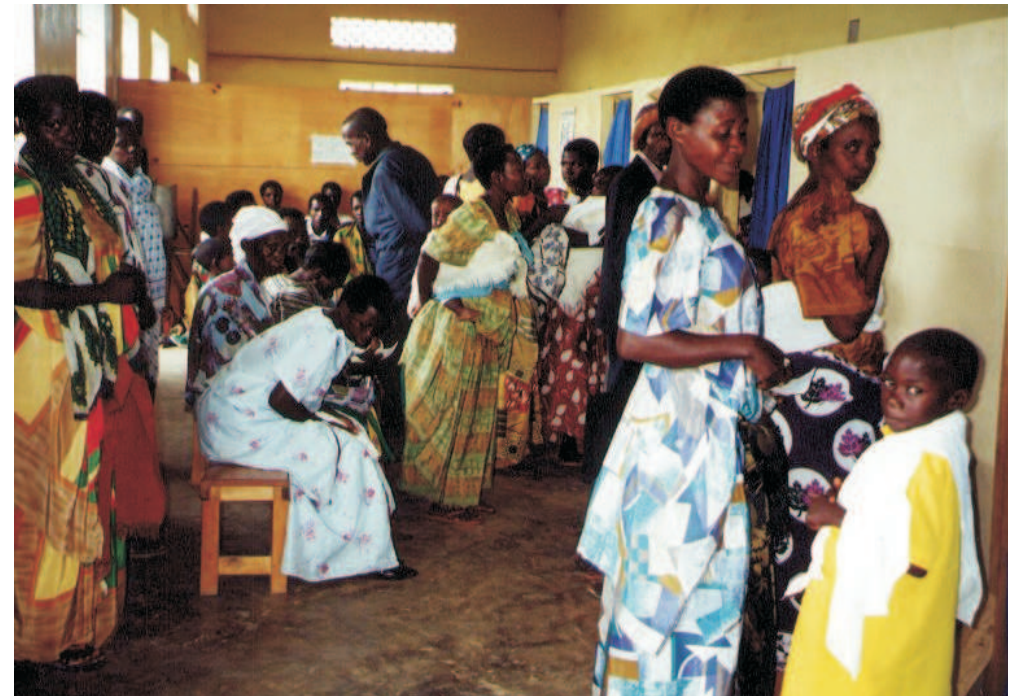
weer een drukke dag in de kliniek

e-mail: Bram@iccf-holland.org giro: 4548774